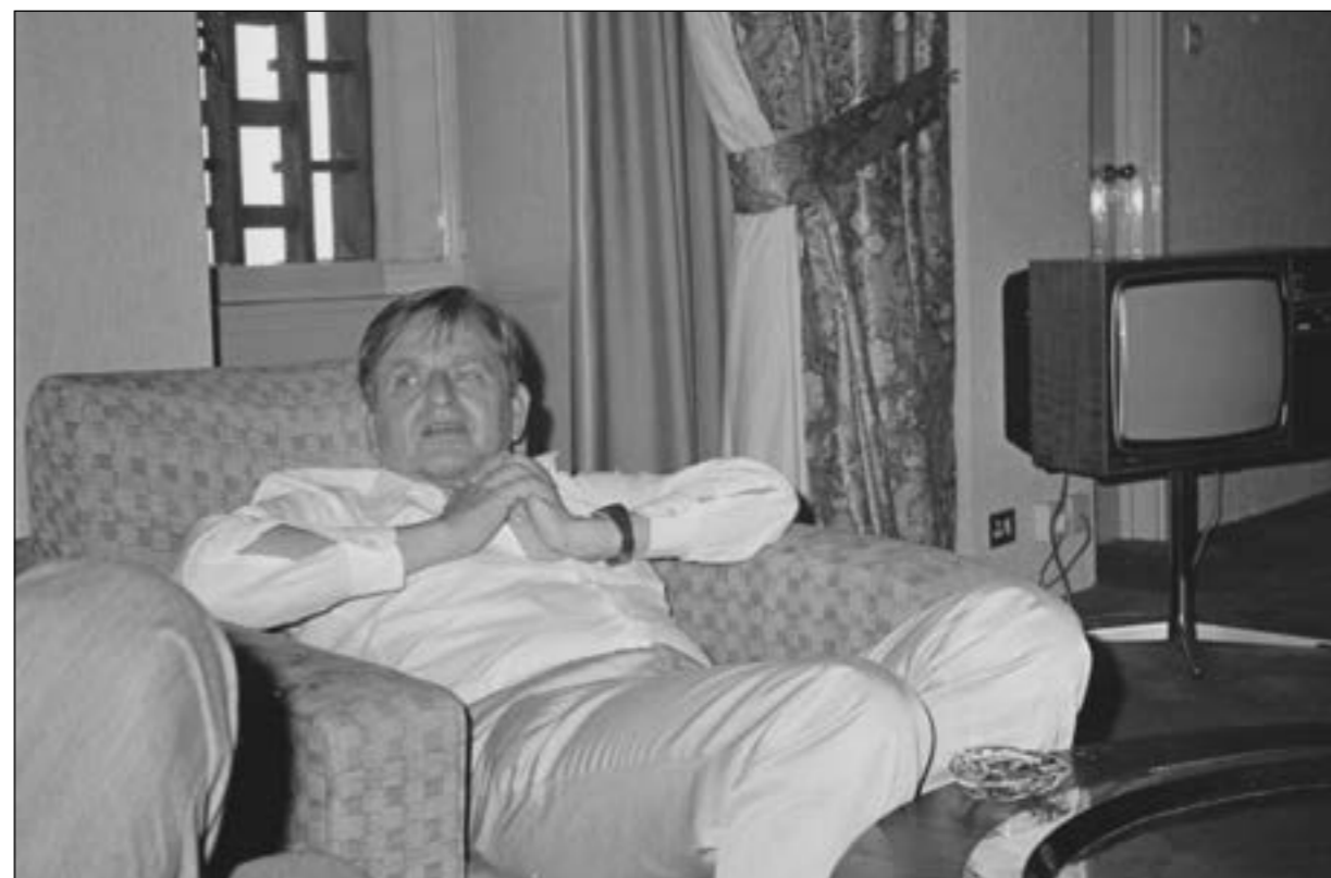
Olof Palme kopplar av på sitt hotellrum efter ankomsten till Teheran – nästa dag möte med de iranska politiska ledarna.

Det hela började i oktober i fjol när FN:s säkerhetsråd diskuterade hur man skulle förhålla sig till kriget mellan Iran och Irak. FN beslutade utse