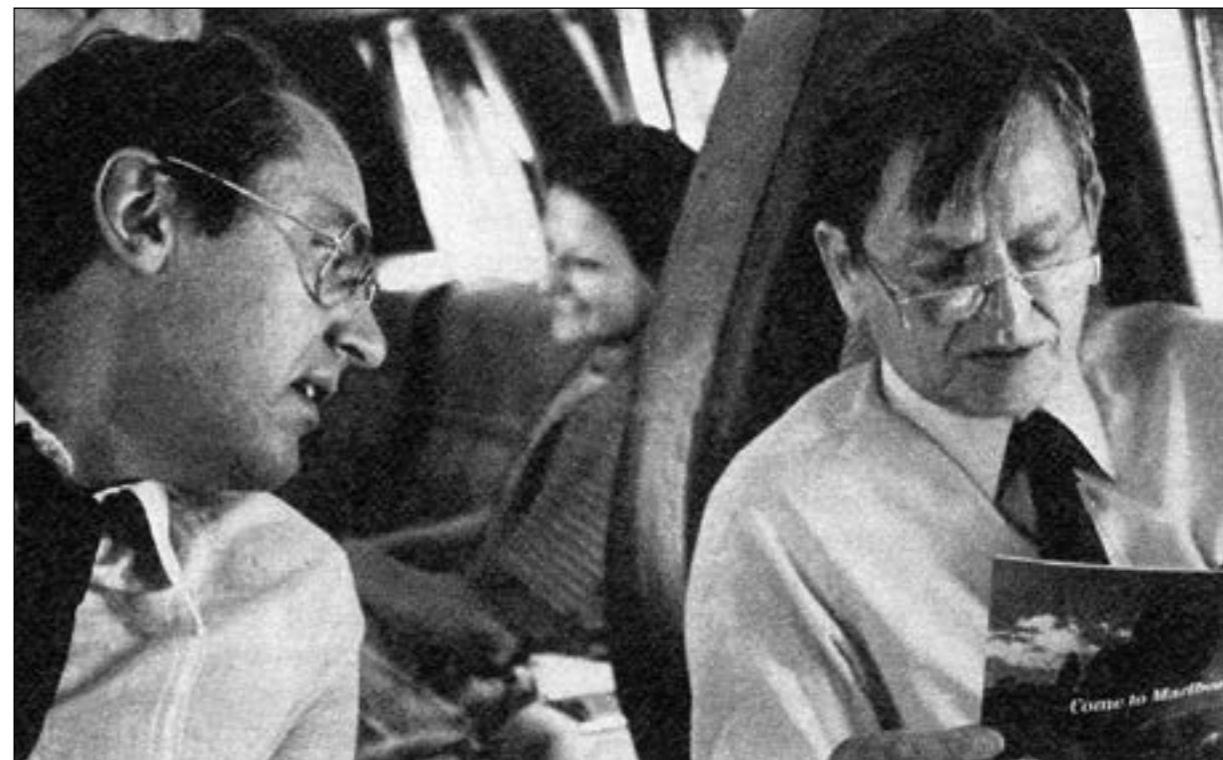
Olof Palme och Jan Eliasson i FN-planet

Har freden en chans, när kriget är heligt?