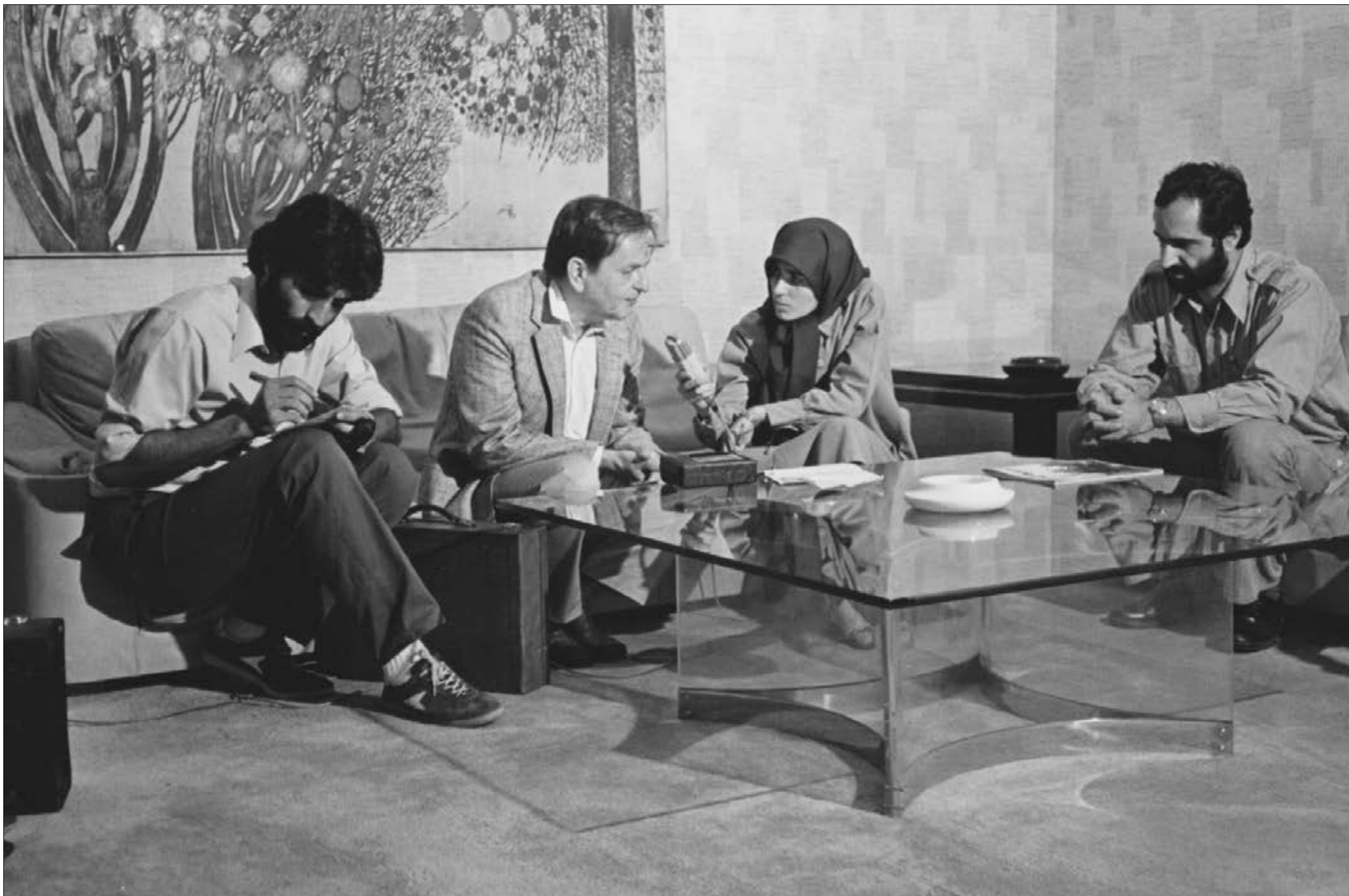
Presskonferens på flygplatsen, Olof Palme intervjuas av en radiojournalist och en skrivande journalist, allt övervakat av ledaren för mottagningskommittén.