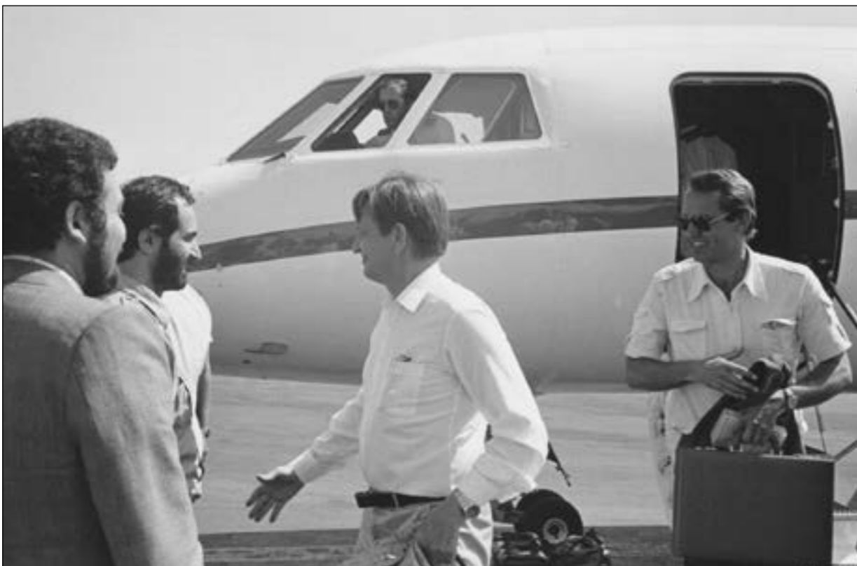
Olof Palme och Jan Eliasson anländer till flygplatsen i Teheran

en talesman för regeringen i Teheran till mig några timmar innan Palme anländer: