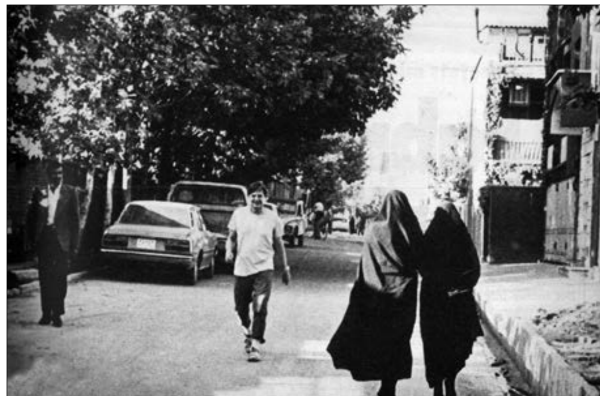
Olof Palme på joggingtur i Teheran, följd av två beväpnade säkerhetsmän i kavaj, den ene syns till vänster på bilden.

Under tiden tar generalsekreterarens speciella sändebud – så kallas Palme – på sig ett par urblekta träningsoverallbyxor, drar sockarna utanpå byxorna och sätter på sig gymnastikskorna. Följd av två säkerhetsmän, båda korrekt klädda i kavaj för att dölja pistolhölstren, ger sig Palme ut på en motionsrunda längs gatorna upp mot bergen ovanför hotellet. FN:s närvaro kan som bekant ta sig många uttryck, men denna form står i en klass för sig. Folk vänder sig om och tittar förvånat. En del känner igen Palme och hejar på