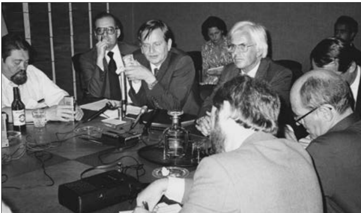
Presskonferens i Geneve, till höger om Olof Palme sitter chefen för FN-kontoret i Geneve och till höger om denne skymtar Jan Eliasson.